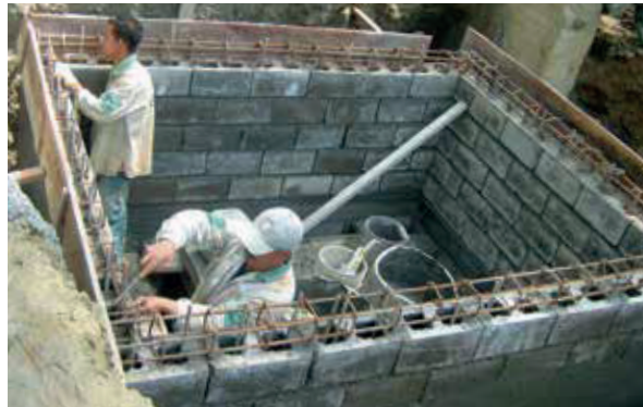
Cámara de energía