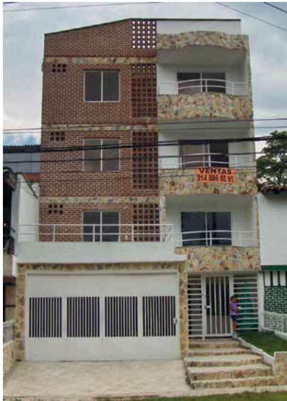
Edificio San Valentín 1 / Belén

Construcción de edificaciones para Vivienda Unifamiliar, Bi familiar y Multifamiliar en áreas de uso Urbano.