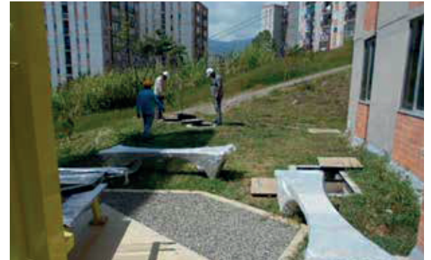
Conjunto residencial La cascada