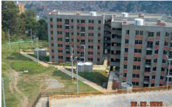
Conjunto residencial La Cascada