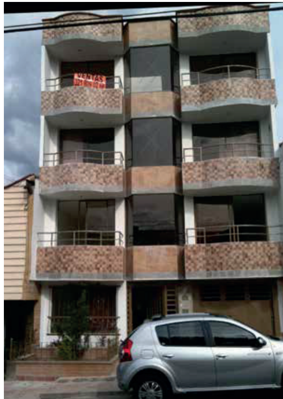
Edificio San Valentín 2 / Santa Monica