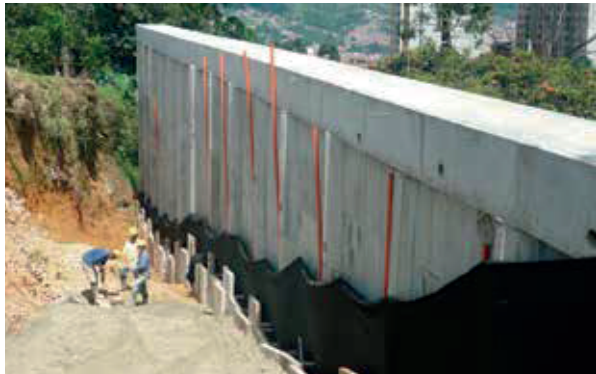
Muro de contención