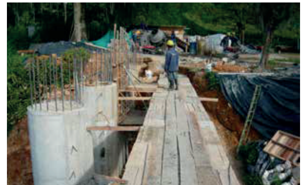
Conjunto residencial La cascada