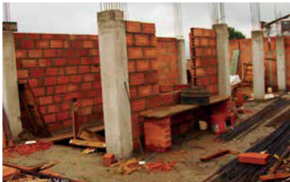
Conjunto residencial La Cascada