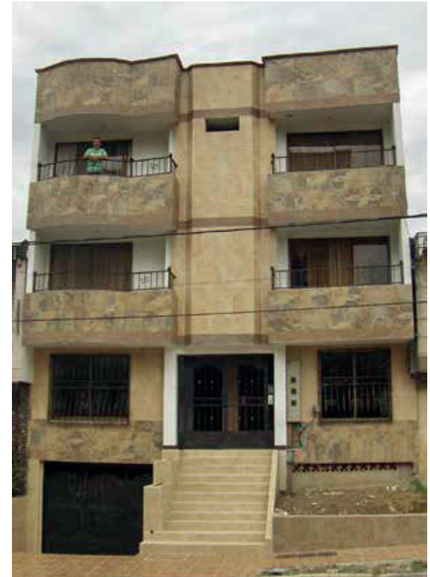
Edificio Villa Mariana / Simón Bolívar