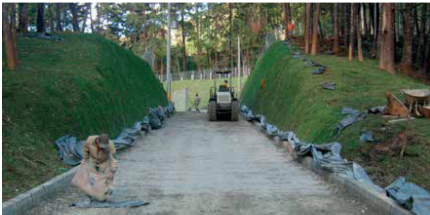
Constructora Zafiro Indigo SAS.