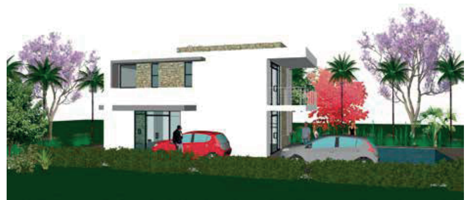
Proyección proyecto Casas Campestres - Parcelación y construcción