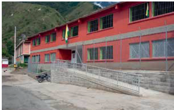
Conjunto residencial La Cascada