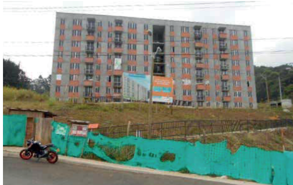
Conjunto residencial La Cascada