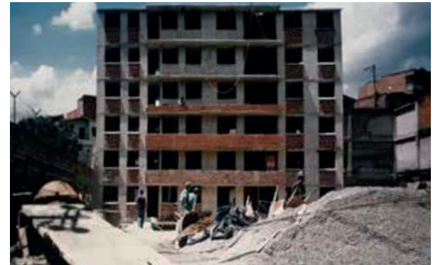
Edificio Dedal del Roble